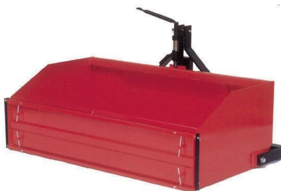
Mechanický kontejner s boční lištou