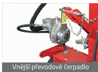
Vnější převodové čerpadlo