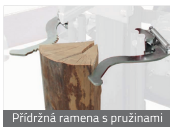
Přidrzná ramena s pružinami