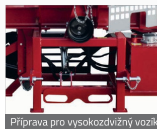
Příprava pro vysokozdvizný vozík