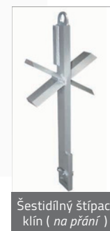
Šestidílný štípací klín ( na přání )