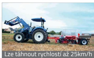
Lze táhnout rychlostí až 25km/h