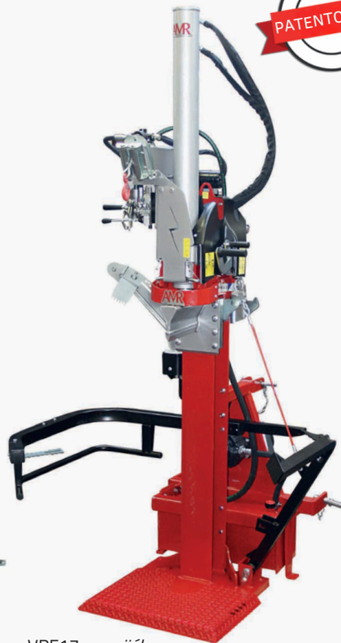
VPF17 s navijákem