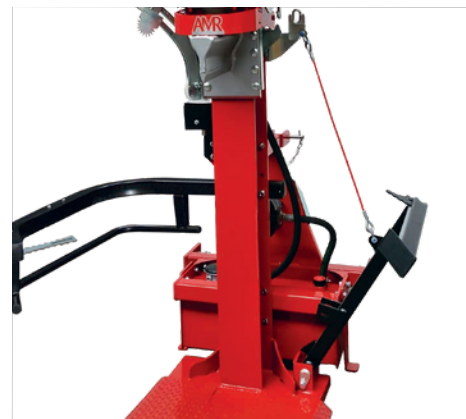
Standardní mechanický zvedák