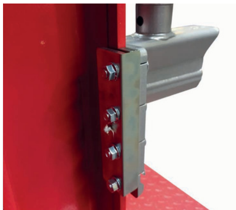
Mosazné vedení s maznicemi