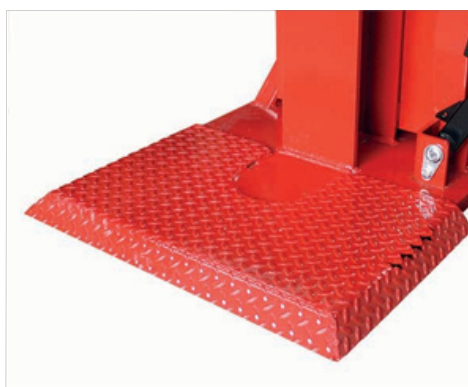
Veliká protiskuzová podlážka