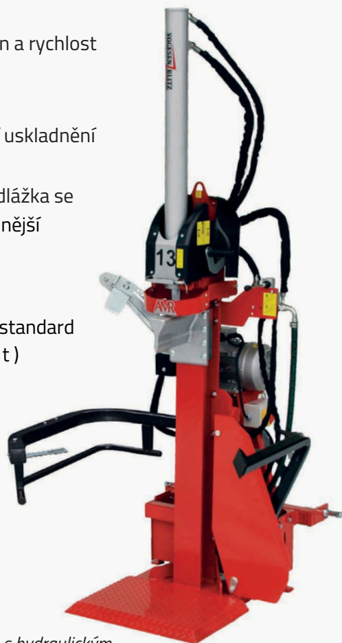
VPE13 s hydraulickým zvedákem