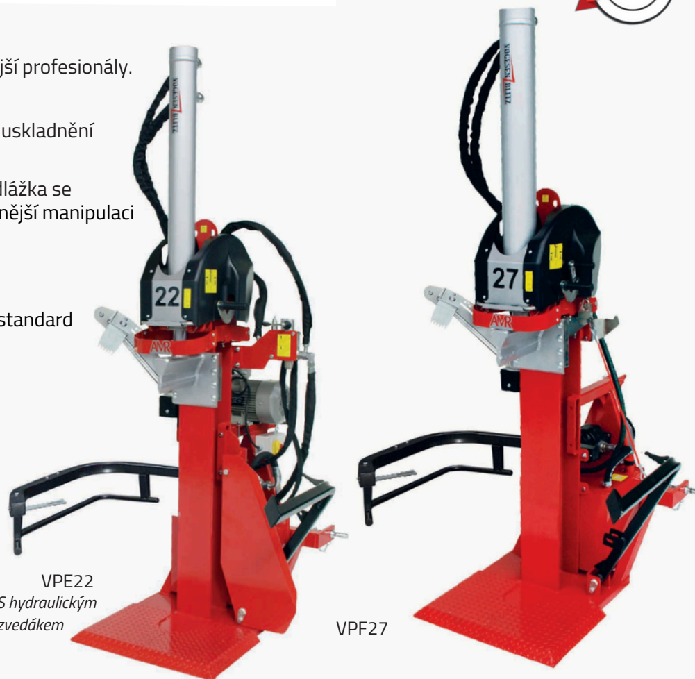
VPE22 S hydraulickým zvedákem