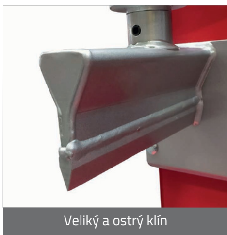
Veliký a ostrý klín