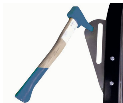
Držák sapie integrovaný do držáku polen