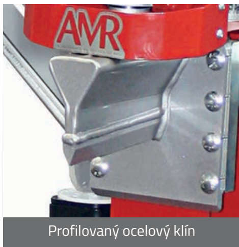
Profilovaný ocelový klín