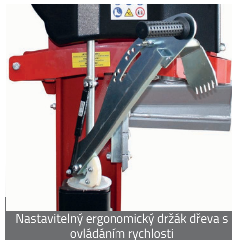
Nastavitelný ergonomický držák dřeva s ovládáním rychlosti