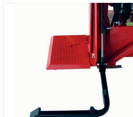
Hydraulický zvedák( na přání )