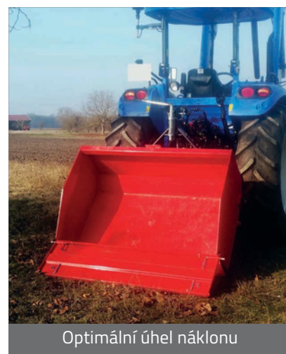
Optimální úhel náklonu