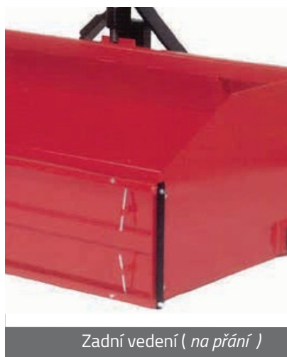
Zadní vedení ( na přání )

Důmyslný kloubový bod, zvyšující robustnost spojení