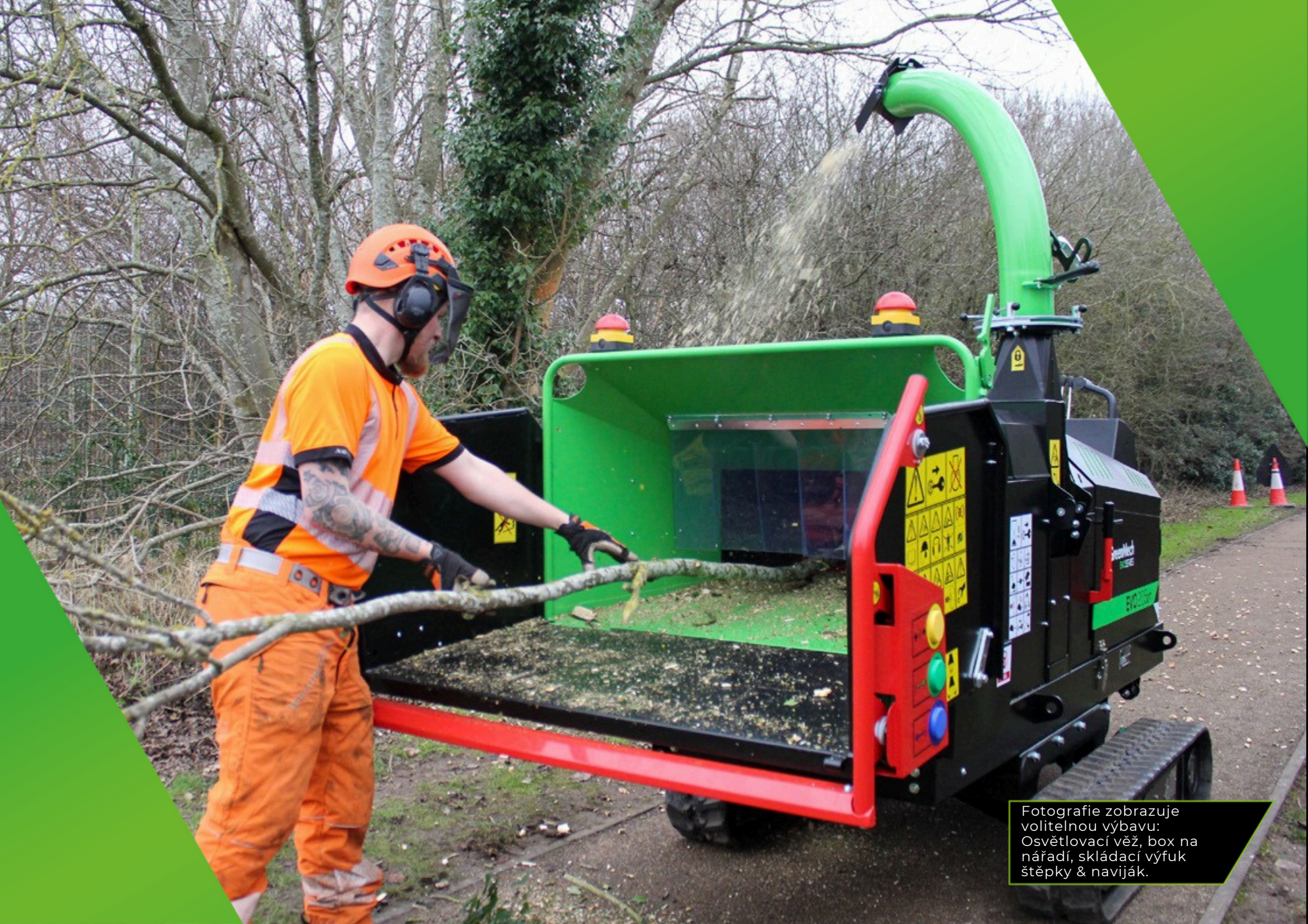
Fotografie zobrazuje volitelnou výbavu: Osvětlovací věž, box na nářadí, skládací výfuk štěpky & naviják.