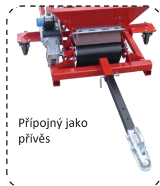
Přípojný jako přívěs